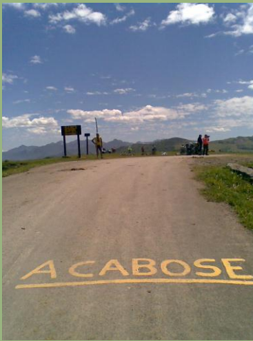
Ruta de la Reconquista 5-6-2010o.