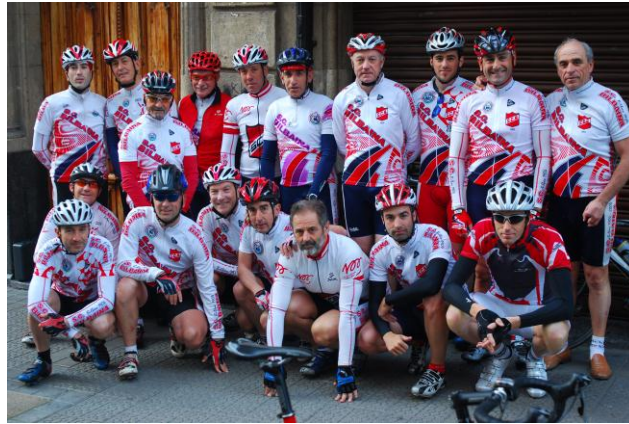
Marcha a Polientes 22-05-2010

C/ Colón de Larreategui, 5-1º izda 48001-BILBAO