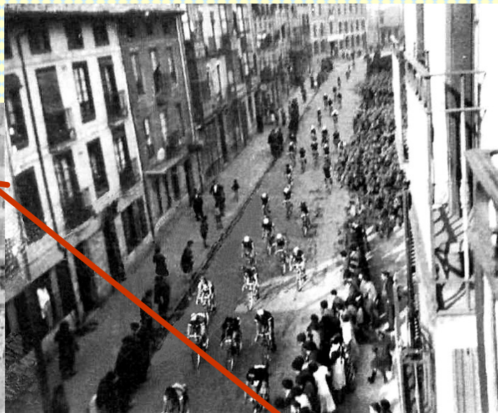
Foto tomada desde el tercer piso de la casa de los Korrika, en 1934.