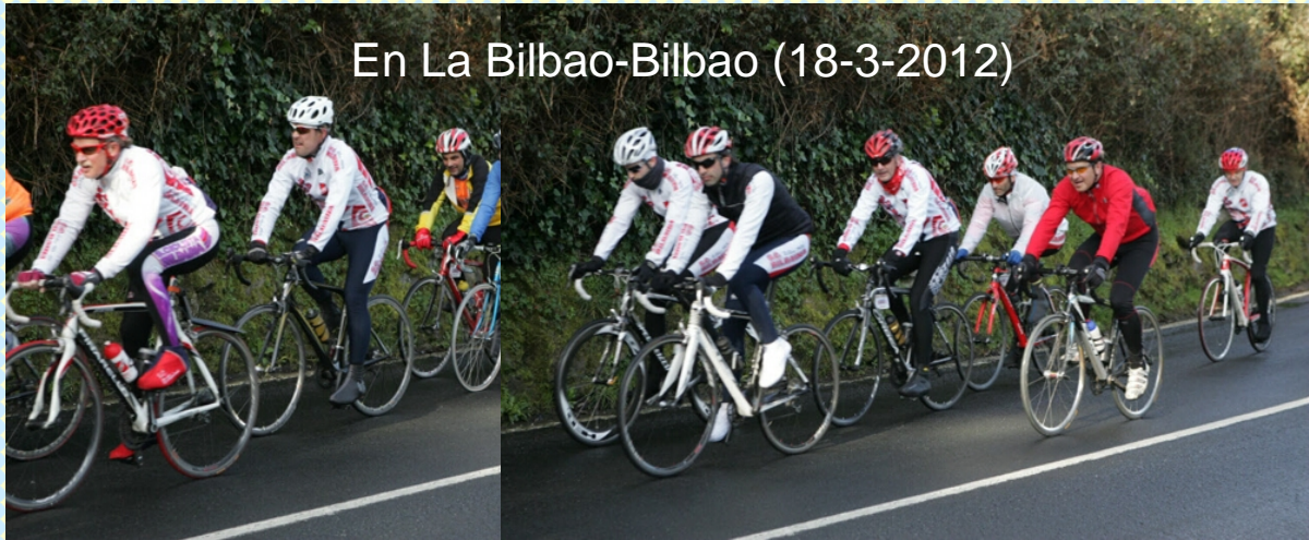
En La Bilbao-Bilbao (18-3-2012)

¿Qué es el Athletic? Después de demostrar a Europa como se juega al fútbol total.