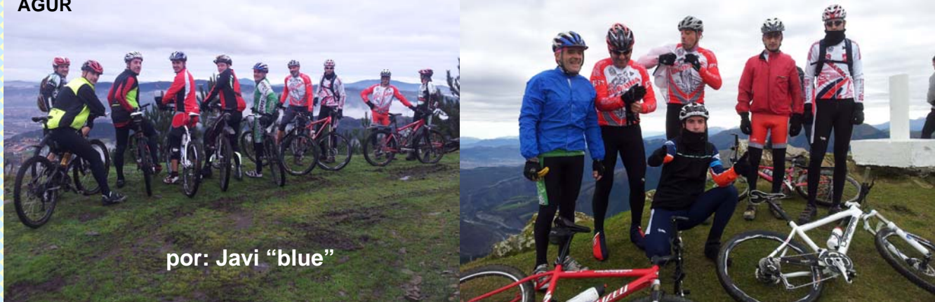
por: Javi "blue"

Todo a salido bien no hay percances nos miramos las ropas algo embarradas y húmedas, recuperamos comentamos y volvemos a hacer planes para ir por el camino que hemos dejado en tal sitio y que nos parece interesante, y nos emplazamos para hacerlo otro día. Buena terapia de grupo. Sabed que hay prevista una salida extra con comida (alubiada) en la zona de Orduña que más adelante pasado el frío invierno y el barro deje ciclar, se hará saber para quien lo estime apropiado. Un saludo a todos y una vez más animar a participar de esta disciplina que da muchas satisfacciones. AGUR