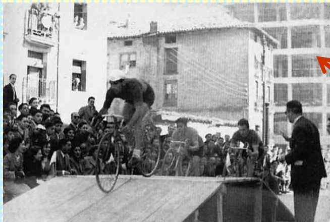
Nueva competición ciclista en la calle Dos de Mayo. Al fondo se ve un edificio en construcción que está junto al enlace que une a ésta calle con la de San Juan.