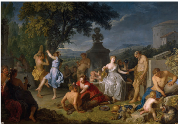
La bacanal. Michel-Ange Houasse (1680-1730).

Si consigues mantener la cabeza cuando a tu alrededor todos la están perdiendo, probablemente no estés al tanto de la gravedad de la situación.